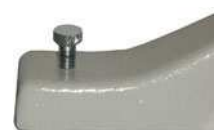
vite di livello