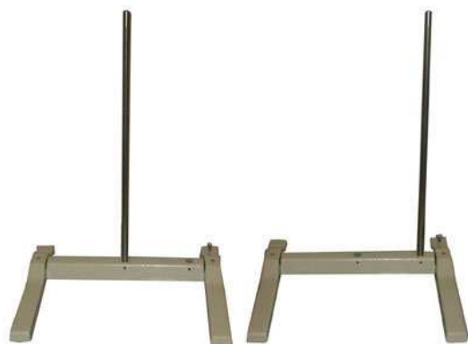
2 posizioni possibili per l'asta di sostegno